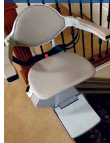
Asiento acolchado y amplio