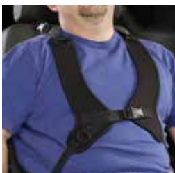
Veste de maintien de la posture et ceinture de positionnement