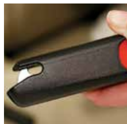
Ensemble de loquet LATCH pour siège de sécurité pour enfant