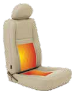
Heated Seat Option

Voir les échantillons de revêtement pour une représentation précise des couleurs